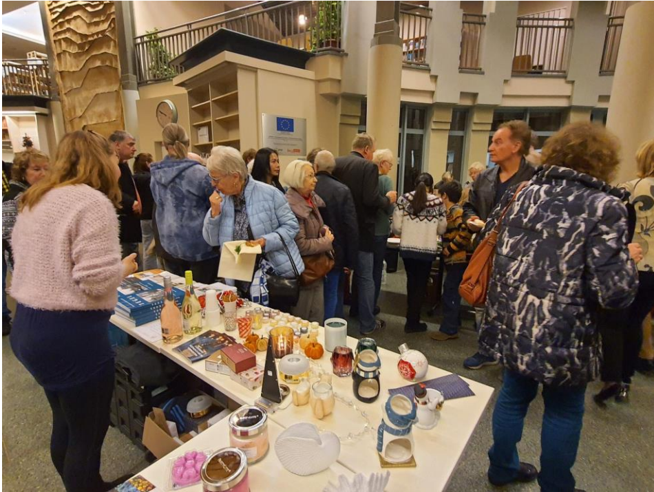
Empfang im Foyer