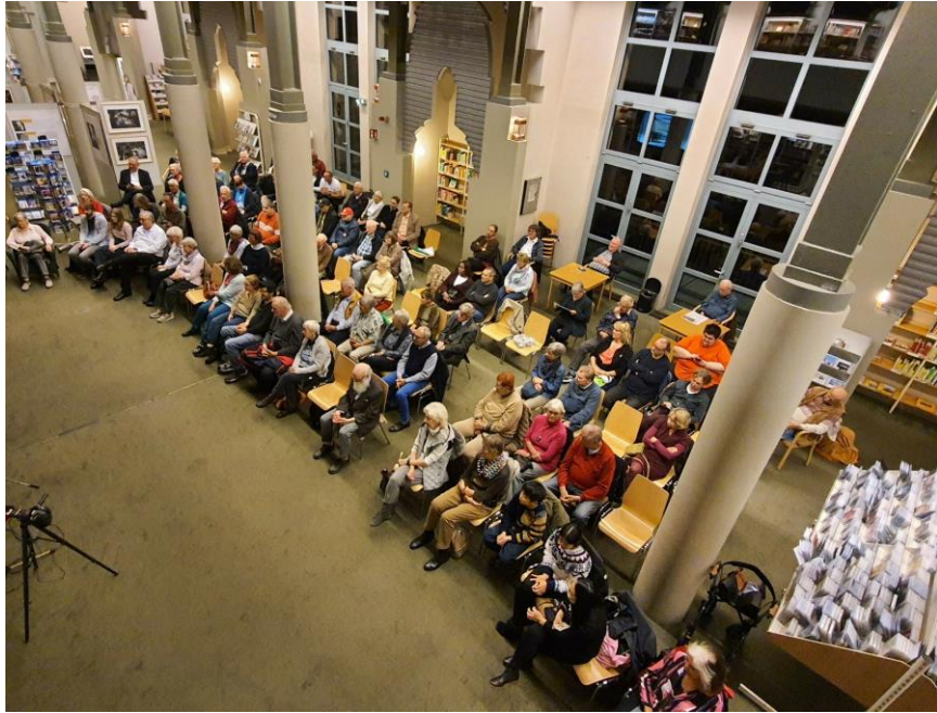
Es waren mehr als 150 Gäste anwesend